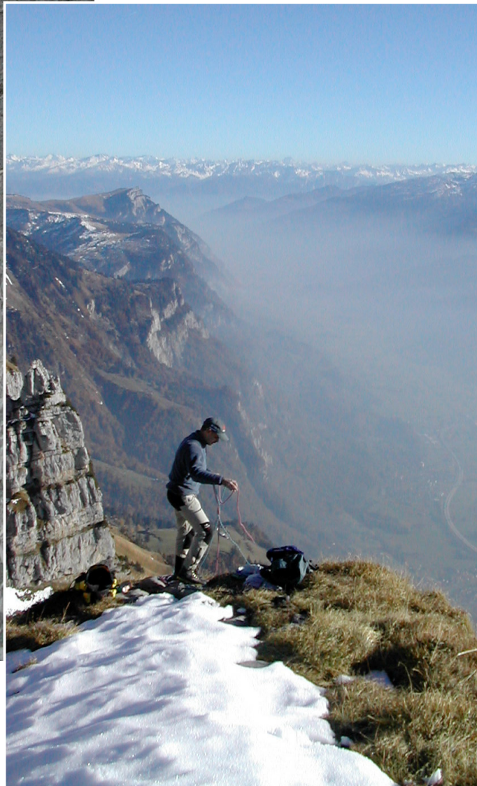
Auf dem Ostpfeiler, Blick Richtung Ostalpen